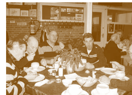
Erwtensoepmaaltijd in Buurtcentrum Morschwijk, Winterfestival 2011